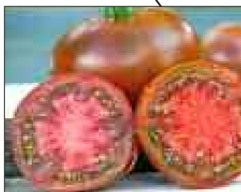
NOIRE DE CRIMÉE

La Tomate Coeur de Boeuf est une variété dont le fruit peut atteindre 200 à 300 g. et même de 500 à 700 g. selon les conditions de cultures en forme de coeur. Cette variété convient pour faire des tomates farcies, des jus de tomates, des soupes mais se mange comme toutes les tomates également nature.