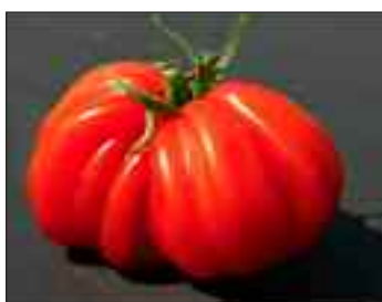
COEUR DE BOEUF

La Tomate Coeur de Boeuf est une variété dont le fruit peut atteindre 200 à 300 g. et même de 500 à 700 g. selon les conditions de cultures en forme de coeur. Cette variété convient pour faire des tomates farcies, des jus de tomates, des soupes mais se mange comme toutes les tomates également nature.